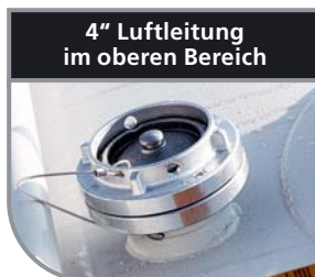
4" Luftleitung im oberen Bereich