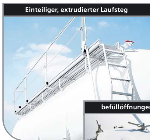
Einteiliger, extrudierter Laufsteg